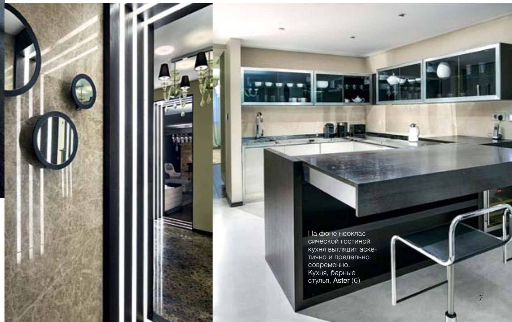
На фоне неоклассической гостиной кухня выглядит аскетично и предельно современно. Кухня, барные стулья, Aster (6)

Интерьер довольно сдержанный: монохромная цветовая гамма, мебель лаконичных форм, строгая геометрия