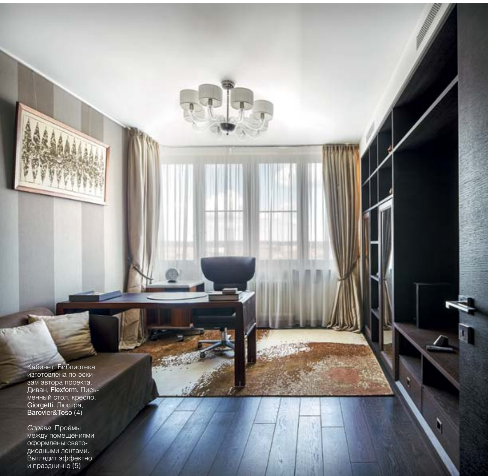
Кабинет. Библиотека изготовлена по эскизам автора проекта. Диван, Flexform. Письменный стол, кресло, Giorgetti. Люстра, Barovier&Toso (4)