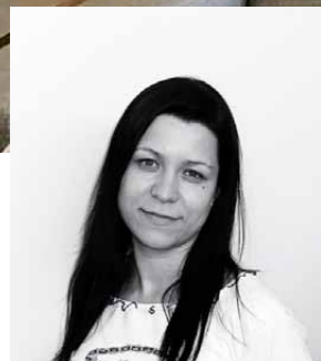
Автор проекта Татьяна Левина (архитектурное бюро ПРОЕКТОР)